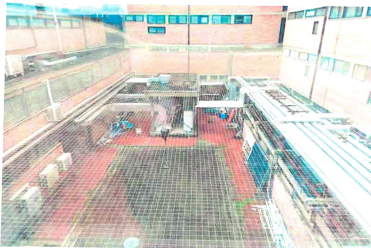
Foto aerea del sistema anti-intrusione ultimato

Nel prossimo mese la Società effettuerà operazioni di monitoraggio per verificare la tenuta dell'impianto e l'intrusione di eventuali volatili.