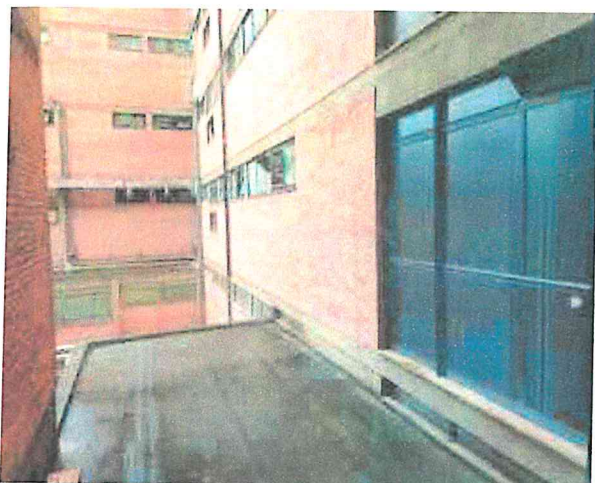
Terrazza Nido Ostetricia a lavoro ultimato